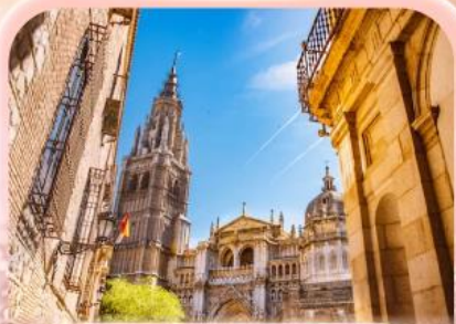
มหาวิหารแห่งโทเลโด

ซาคราเดา ที่ว่ายิ่งใหญ่ ยังไม่ทำใจ... ที่ให้เธอไปหมดแล้ว