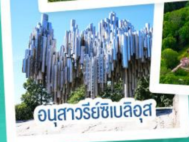
อนุสาวรีย์ซิบิลูส

ฟินแลนด์ - เอสโตเนีย - ลัตเวีย - ลิทัวเนีย แวะเที่ยวเซี่ยงไฮ้