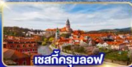
เชสกีครุมลอฟ