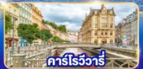
คาร์โรวารี