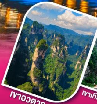
เวาอวตาร