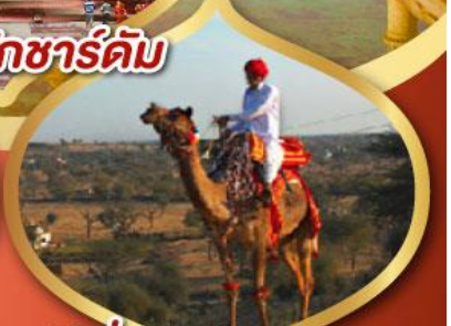
ฟรี ขี่อูฐ เมืองมันทาวา ราคาเริ่มต้น