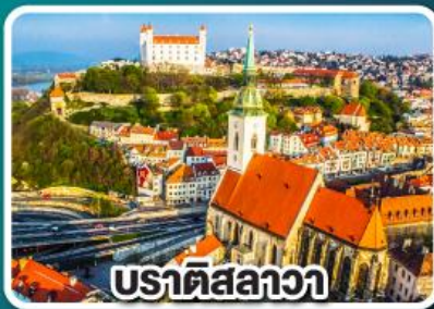
ปราตีสลาวา