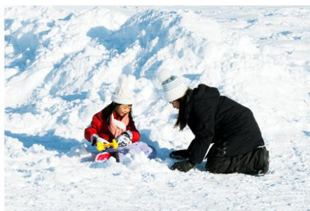
Playing in the snow