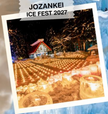
JOZANKEI ICE FEST 2027