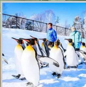
"PENGUIN ASAHIYAMA ZOO"