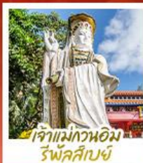
เจ้าแม่กวนอิม รพีลัสสัย