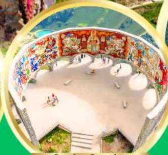
Russian-Georgian Friendship Monument