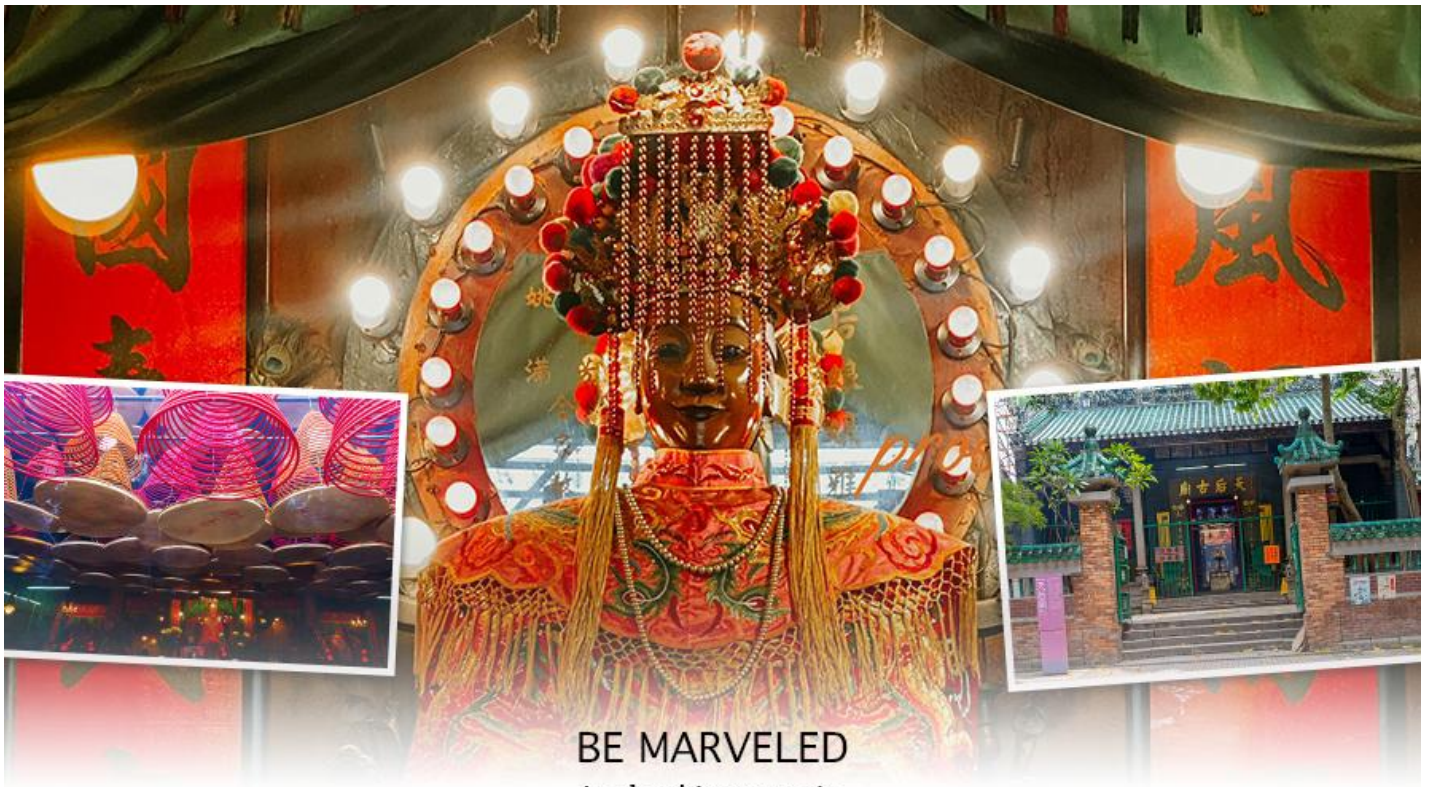
BE MARVELED วัดเจ้าแม่ทับทิมทินฮั่ว

ทองเหลืองอยู่ด้านล่าง นอกจากการมาสักการะบูชาเจ้าแม่ทับทิมในเรื่องของการเดินทางให้ปลอดภัยแล้ว ไฮไลท์สำคัญอีกอย่างหนึ่งของวัดเจ้าแม่ทับทิม ทินฮั่ว (Tin Hau Temple) จะเป็นขดรูปสี่แดงขนาดใหญ่ ที่แขวนอยู่ตามเพดานด้านในวิหารของวัดเต็มไปหมด จะยิ่งสวยงามในยามที่มีแสงแดงส่องลงมาเหมือนเป็นลำแสงส่องทะลุควันรูปแปลกตา ยิ่งนัก ส่วนอาคารของวัดก็จะเป็นสถาปัตยกรรมแบบวัดจีน สร้างขึ้นตั้งแต่ปีค.ศ. 1876 โดยทางเข้าของวัดจะอยู่ติดกับสวนสาธารณะเล็กๆ ที่มีต้นไม้ใหญ่หลายต้น ให้บรรยากาศร่มรื่น