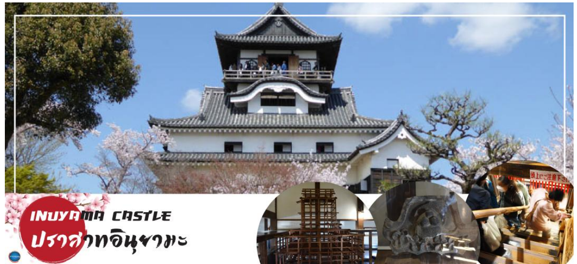
INUYAMA CASTLE ปราสาทอินยามะ

นำท่าน เข้าชม ปราสาทอินยามะ (Inuyama Castle) ตั้งอยู่ใจกลางเมืองอินยามะ ทางตะวันตกเฉียงเหนือของจังหวัดไอจิ ประเทศญี่ปุ่น เป็นปราสาทที่สร้างขึ้นในตอนปลายศตวรรษที่ 16 ที่อยู่รอดมาจนถึงปัจจุบัน ปราสาทแห่งนี้มีความพิเศษตรงที่มีหอคอยที่มีความเก่าแก่ที่สุดในประเทศ ดังนั้นปราสาทแห่งนี้จึงได้รับการประกาศให้เป็นสมบัติของชาติ ด้านในของปราสาทมีการจัดแสดงอาวุธในการทำสงครามในสมัยต่าง ๆ ของญี่ปุ่น และเราสามารถเดินขึ้นไปด้านบนเพื่อชมความงามของตัวเมืองอินยามะ ตลอดจนแม่น้ำคิโซะ และที่ราบโนบิได้