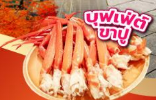
บุฟเฟ่ต์ ซาซู

เช็किनจุดถ่ายรูป ศาลเจ้าฟูจิซัง ฮงกุเซ็นเกินไทยะ