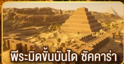
พีระมิดขั้นบันได ชิคคาร์่า