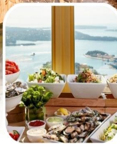
SKYFEAST BUFFET SYDNEY TOWER