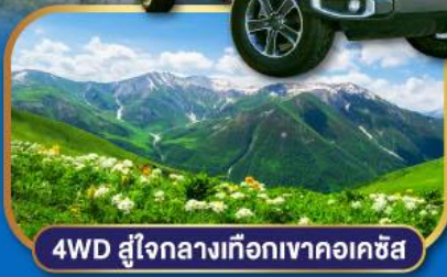
4WD สู๊ใจกลางเทือกเขาคอเคซัส