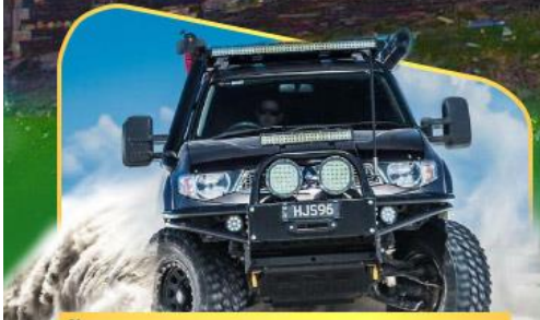
คันรถ 4WD สู่ใจกลางเทือกเขาคอเคซัส