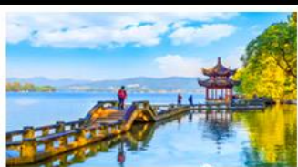
ทะเลสาบซึกุ