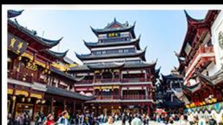
ตลาดร้อยปีเมืองหัวฝาง