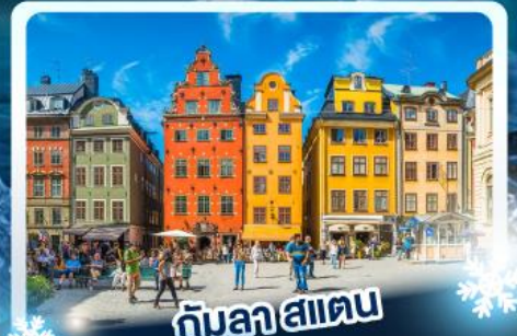
คิรูกูเฟล