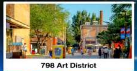
798 Art District