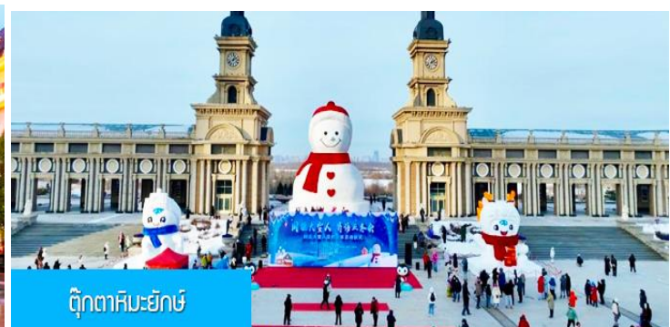
ตุ๊กตาคิมะยักซ์