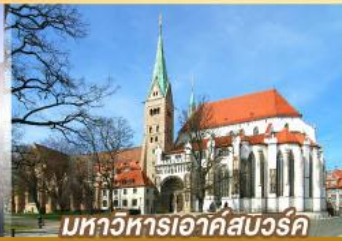
มหาวิหารเอาค์สเวิร์ค