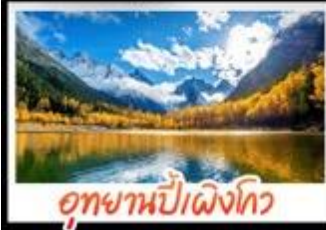
อุทยานป่าแดงโกว