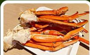
เมนูพิเศษ! ซาซิมิ