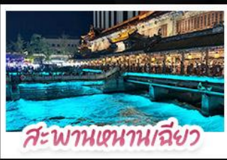
สะพานเสนาหนเจียว