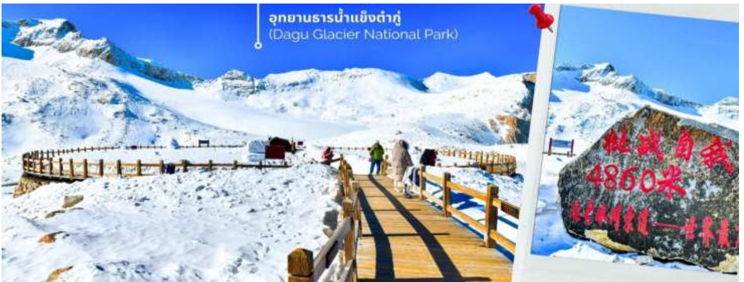
การตกและความหนาวของหิมะขึ้นอยู่กับสภาพอากาศ

จากนั้นนำท่านเดินทางสู่ เมืองเฮยส่วย (ใช้เวลาเดินทางประมาณ 2.5 ชั่วโมง) เพื่อเดินทางไปยัง อุทยานธารน้ำแข็งต้ากู่ปิงชวน(รวมกระเช้าขึ้นลง) ต้ากู่ปิงชวน หรือ Dagu Glacier National Park เป็นธารน้ำแข็งกลาเซียร์ที่สวยงามที่สุดแห่งหนึ่งของโลก และเป็นสถานที่ท่องเที่ยวระดับ 4A ของจีน ตั้งอยู่ที่เมืองเฮยส่วย ในมณฑลเสฉวน ห่างจากเมืองเฉิงตูประมาณ 300 กิโลเมตร ถือเป็นธารน้ำแข็งที่อายุน้อยที่สุด ที่ตั้งอยู่ในระดับความสูงที่ต่ำที่สุด และอยู่ใกล้กับเมืองมากที่สุดในบรรดาธารน้ำแข็งทั้งหมด โดยอยู่สูงจากระดับน้ำทะเลประมาณ 3,800-5,100 เมตร จุดสูงที่สุดที่นักท่องเที่ยวสามารถขึ้นไปได้จะอยู่ที่ 4,860 เมตร