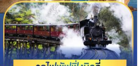
รถไฟพัพฟิงบิลลี่

ล่องเรือชมอ่าวซิดนีย์พร้อมรับประทานอาหารกลางวัน และ เข้าชมสวนสัตว์การองก้า