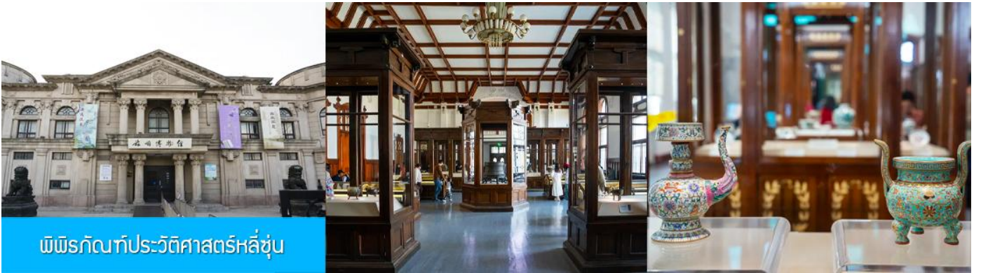
พิพิธภัณฑ์ประวัติศาสตร์หลี่ซุ่น

นำท่านเที่ยวชมและเก็บภาพ ณ สถานีรถไฟหลี่ซุ่น 旅顺火车站 เป็นสถานีปลายทางของเส้นทางรถไฟสาขา เลิ่นหยาง - ต้าเหลียน สร้างขึ้นในปีค.ศ. 1903 ออกแบบโดยสถาปนิกชาวรัสเซีย เป็นอาคารอิฐก่อปูนผสม โครงสร้างไม้ตามสถาปัตยกรรมรัสเซีย.