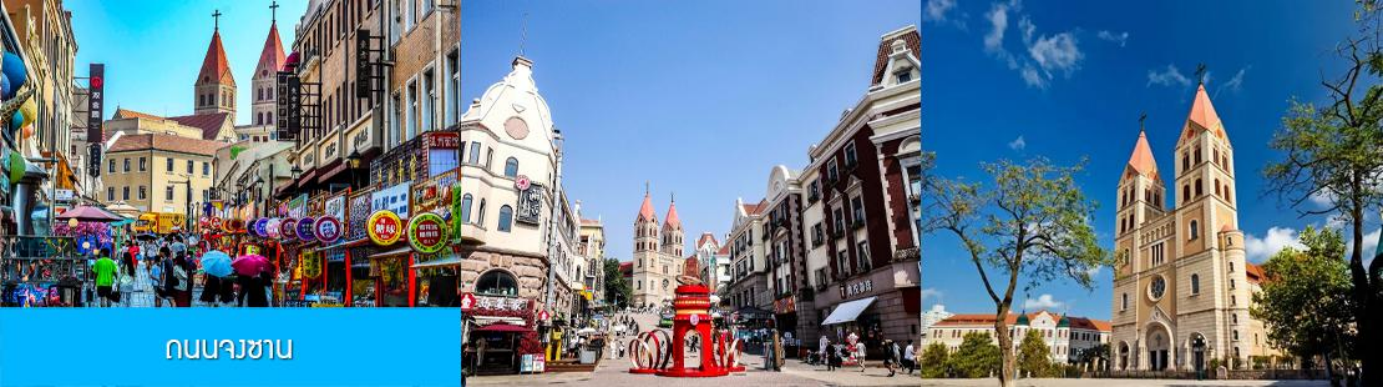
ถนนจงชาน

หลังอาหารนำท่านเดินทางชม สะพานจ้านเฉียว 栈桥 เป็นแลนด์มาร์กแห่งประวัติศาสตร์คู่เมืองชิงเต่า สร้างเมื่อปี ค.ศ.1891 มีลักษณะเป็นสะพานหินทอดยาวกว่า 440 เมตรสู่ทะเล ปลายสะพานมีศาลา ทรงแปดเหลี่ยมสีแดงที่โดดเด่น ซึ่งเป็นสัญลักษณ์บนฉลากเบียร์ชิงเต่า ขึ้นชื่อเรื่องวิวสวย รับลมทะเล ให้ท่านเก็บภาพบรรยากาศ