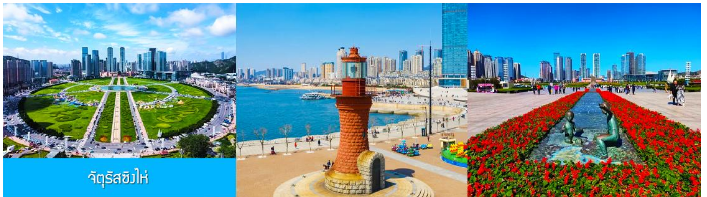
จัตุรัสซีไห่

จากนั้นนำท่านเที่ยวชมและเก็บภาพ ณ พิพิธภัณฑ์ประวัติศาสตร์หลี่ซุ่น 旅顺博物馆 เป็นอาคารพิพิธภัณฑ์เก่าแก่อายุกว่าร้อยปีแห่งแรกที่สร้างขึ้นทางภาคตะวันออกเฉียงเหนือของจีน อาคารพิพิธภัณฑ์มีความโดดเด่นด้วยสถาปัตยกรรมแบบกรีกโรมันยุคเรเนซองส์ ผสมผสานสถาปัตยกรรมแบบตะวันตก ภายในมีการจัดแสดงโบราณวัตถุกว่า 60,000 ชิ้น ท่านสามารถเก็บภาพที่ระลึกด้านหน้าอาคารพิพิธภัณฑ์ และสามารถเข้าชมโบราณวัตถุภายในพิพิธภัณฑ์ได้ตามอัธยาศัย (พิพิธภัณฑ์ปิดทุกวันจันทร์)..