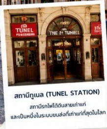
สถานีทูนเนล (TUNEL STATION) สถานีรถไฟใต้ดินสายเก่าแก่ และเป็นหนึ่งในระบบขนส่งที่เก่าแก่ที่สุดในโลก

ไอโอดีที่ห้ามพลาด! รถรางสีแดงสัญลักษณ์ ของย่านทักซิม