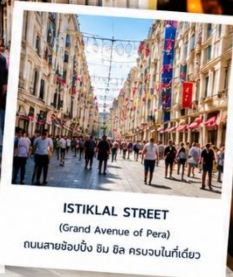
ISTIKLAL STREET (Grand Avenue of Pera) ถนนสายช้อปปิ้ง อิม บิล ครอบคลุมในที่เดียว