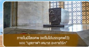
ภายในมีสิ่งศพ (แต่ไม่ได้รับอนุญาต) ของ "มุสตาฟา เคมาล อะตาเติร์ก"