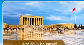
บริเวณด้านหน้าอนีกาบิร์

สถานที่สำคัญที่คนตุรกีให้ความเคารพและจดจำผู้นำผู้ยิ่งใหญ่ ที่อุทิศทั้งชีวิตเพื่อชาติ ศาสนา และประชาชน