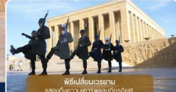
พิธีเปลี่ยนเวรยาม แสดงให้เห็นเคารพและเกียรติยศ

ได้เวลาเดินทางทางสู่เมือง "ซาฟรานโบลู" (Safranbolu) คือเมืองท่องเที่ยวที่มีชื่อเสียงของจังหวัดการาบิก (Karabük) ในภูมิภาคทะเลดำตุรกี เป็นเมืองที่มีความสำคัญทางด้านประวัติศาสตร์ของประเทศ ตุรกี โดยเฉพาะชื่อเสียงเกี่ยวกับสถาปัตยกรรมซาฟรานโบลู ที่มีอิทธิพลต่อพัฒนาการชุมชนเมืองทั่วทั้งจักรวรรดิออตโตมัน ต่อมาในปี 1994 เมืองซาฟรานโบลู ได้ถูกองค์การยูเนสโกยกให้เป็นมรดกโลกทางด้านวัฒนธรรม