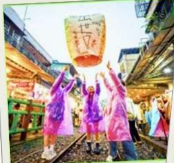
ปล่อยโคมลอย