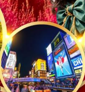
ช้อปปิ้งชินโซบาช