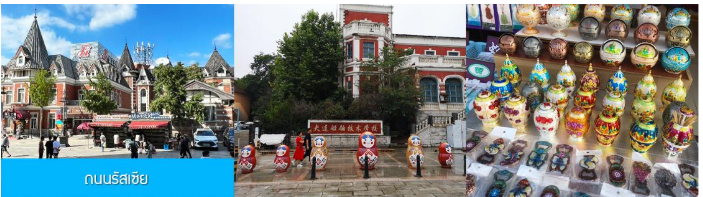
ถนนรัสเซีย

จากนั้นนำท่านขึ้น รถรางไฟฟ้า 有轨电车 เป็นรถรางไฟฟ้าที่สร้างขึ้นในปี ค.ศ. 1909 โดยบริษัทญี่ปุ่น (เมืองต้าเหลียนเคยตกเป็นเมืองขึ้นของญี่ปุ่นในปีค.ศ. 1900 – 1945 ) นำท่านนั่งรถรางโบราณผ่านชมตัวเมืองต้าเหลียน หนึ่งในเมืองแรก ๆ ที่มีบริการรถรางไฟฟ้าเปิดให้บริการในเขตเมือง ปัจจุบันมีเพียงสายที่ยังเปิดให้บริการในเมืองต้าเหลียน.