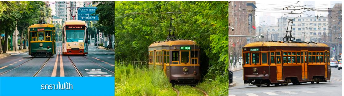
รถรางไฟฟ้า