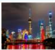
เชียงใหม่ ทัศนิก ไนท์