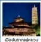
หมู่บ้านเหมียนฮวาฮวาน