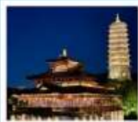
เมืองโบราณผู้หยวน

เมืองโบราณผู้หยวน / ภูเขาหินัวส์วชาน (รวมรถกอล์ฟ) ห้างสรรพสินค้าเต๋อจี / วัดจีหมิง / ทะเลสาบเซวียนอู่ ถนนอู่กงต้าเต้า / อู๋ซีหมู่บ้านเหียนฮวาวาน / เซาหูซิว เชียงใหม่ ทัศนิก ไนท์ / ถนนนานกิง / Tian An 1,000 Trees North Bund Green Land / Florentia Village Outlet