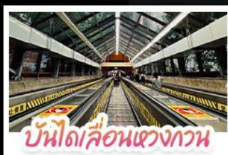
บันไดเลื่อนแขวงกาน