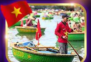
เรือกระด้ง หมู่บ้านก๊อตัน