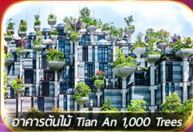
อาคารต้นไม้ Tian An 1,000 Trees