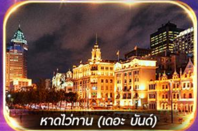
หาดว่อกาน (เดอะ บันด์)

เที่ยวดิสนีย์แลนด์เต็มวัน (รวมรถรับ-ส่ง)