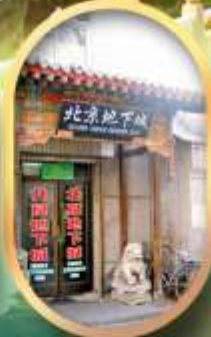
เมืองโบราณใต้ดิน