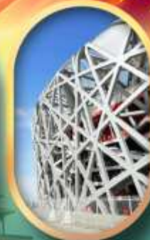
ผ่านชมสนามกีฬาาริงนก