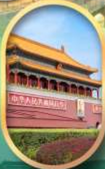
จัสมุติสเทียนอันเหมิน