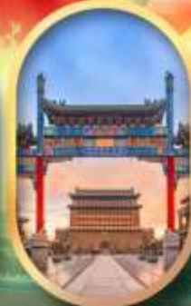
ถนนคนเดินเทียนเหมิน