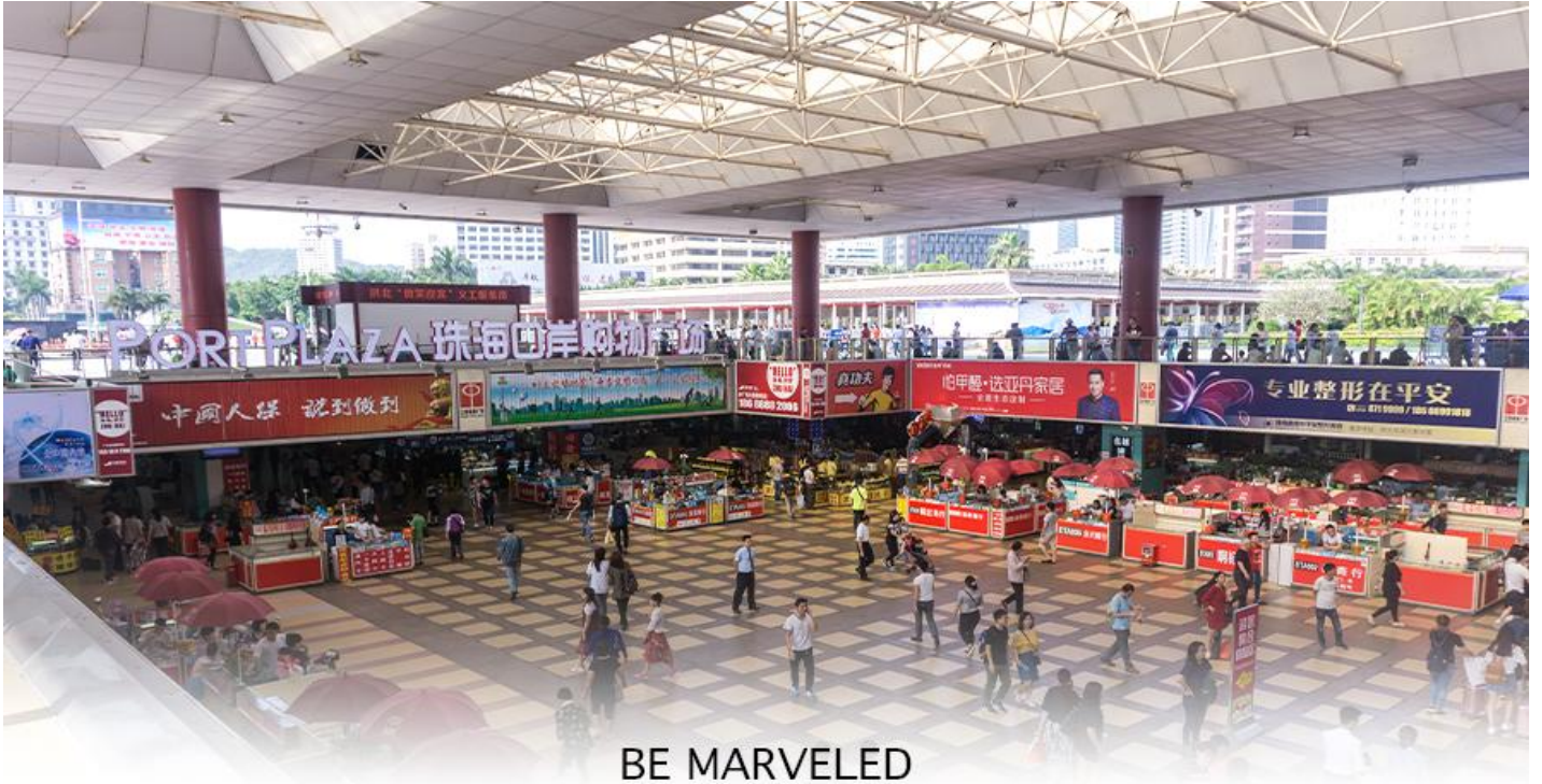
BE MARVELED ตลาดใต้ดิน กวเป่ย์

📍 อิสระอาหารอาหารเย็นตามอัธยาศัย **เพื่อความสะดวกในการซื้อปิ้ง**