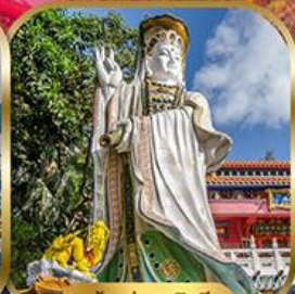
เจ้าแม่กวนอิม พลัสเบย์