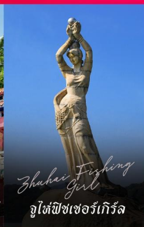
Zhuhai Fishing Girl จูไห่ฟิชเชอร์เก็ท