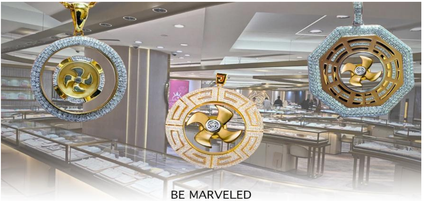
BE MARVELED ศูนย์ฮวงจุ้ย กัศหันเศรษฐี

นำท่านชม ศูนย์ฮวงจุ้ย กัศหันเศรษฐี ที่ขึ้นชื่อของฮ่องกง ท่านจะได้พบกับงานดีไซน์ที่ได้รับรางวัลยอดเยี่ยม และใช้ในการเสริมดวงเรื่องฮวงจุ้ย โดยการย่อใบพัดของกังหันที่เป็นสัญลักษณ์ของวัดวัดเซ่งหิม มาทำเป็นเครื่องประดับ ไม่ว่าจะเป็นจี้, แหวน, กำไล หรือต่างหูเพื่อเป็นเครื่องประดับติดตัว และเสริมดวงชะตา ซึ่งสินค้าทุกชิ้น มีเอกสาร รับประกันคุณภาพเปลี่ยนหรือซ่อม ได้ตลอดอายุการใช้งาน หากเกิดการชำรุดจากสินค้าไม่ใช่อุบัติเหตุ