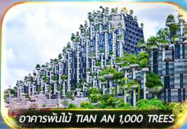
อาคารพินไม TIAN AN 1,000 TREES