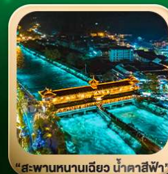
“สะพานหนานเฉียว น้ำคาสีฟ้า”