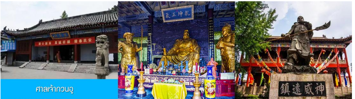
ศาลเจ้ากวนอู