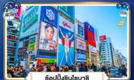
ช้อปปิ้งชินโซบาสึ