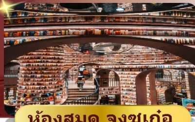
ห้องสมุด จงซูเก้อ