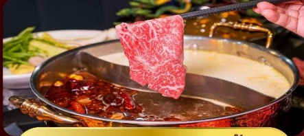
ชาบูหม่าล่าไม่อัน