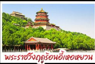
พระราชวังฤดูร้อนอี๋เหอหยวน

กำแพงเมืองจีนด่านจวิรงกวน - พระราชวังฤดูร้อนอี๋เหอหยวน สวนจิ่งอัน - วัดลามะ - โม่งร้านซ้อป - โรงแรม 4 ดาว บ๊อพิศษ เปิดปักกิ่ง สุกิมองโก MICHELIN GUIDE ร้าน TAO TAO JU