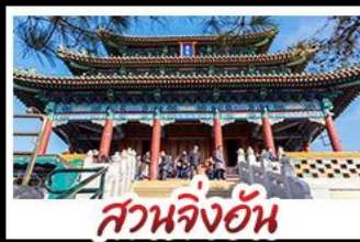
สวนจิ่งอัน