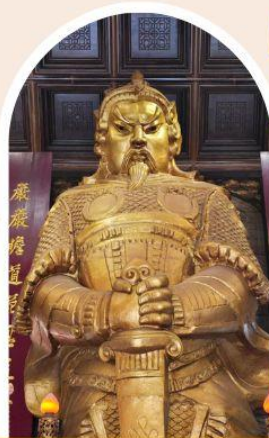
วัดแชกง ขอพรโชคลาง การเงิน และธุรกิจ