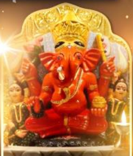
องค์สิทธีวินายิก