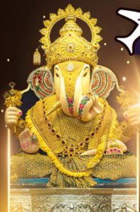
องค์ดีกษุท์เศษฐ์