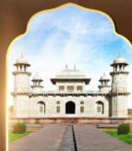
ทัชมาฮาลน้อย