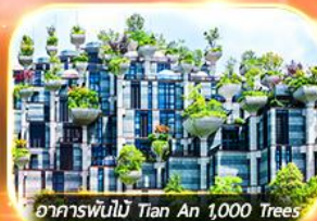
อาคารพันไม้ Tian An 1,000 Trees