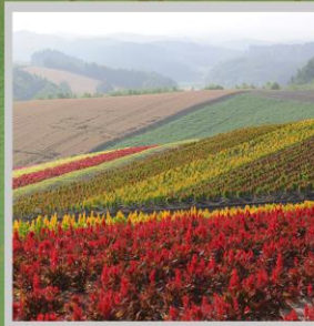
"SHIKISAI NO OKA"