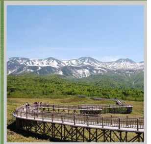
"SHIRETOKO 5 LAKES"