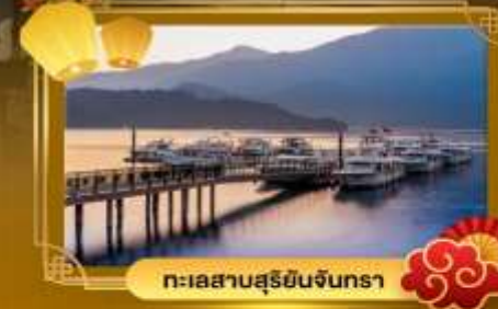
ทะเลสาบสุริยจันทร์