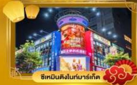
ช้อปปิ้งคืนไม่จำกัด