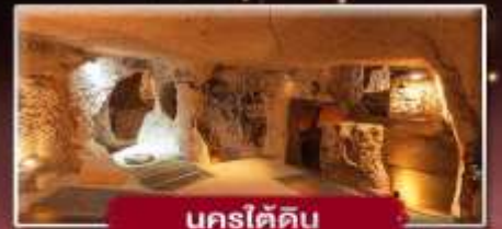
นครใต้ดิน